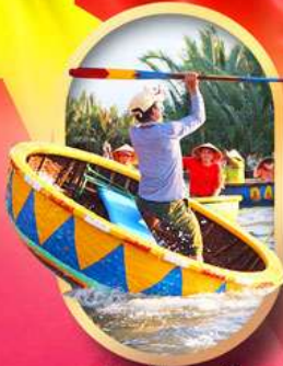
ล่องเรือกระดังง์