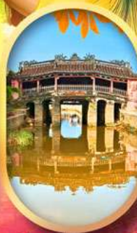
เมืองเก่าฮอยอัน