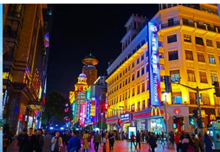
ถนนคนเดินหนานจิงลุ่