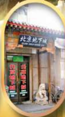
เมืองโบราณใต้ดิน