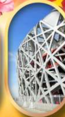
ผ่านชมสนามกีฬาโอลิมปิก