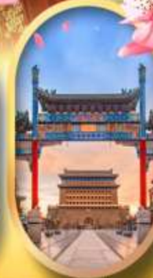
ถนนคนเดินเจียมเหมิน