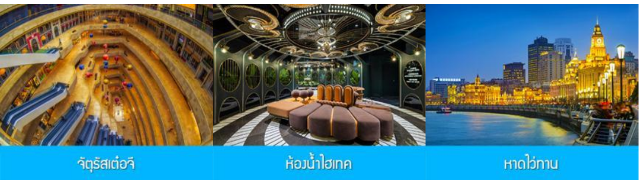
จัตุรัสเต๋อจี

พักที่ โรงแรม Holiday Inn Express Dongshan Hotel 4* หรือเทียบเท่าในนครหนานจิง