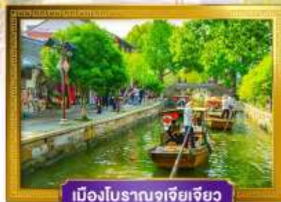
เมืองโบราณซูโจว