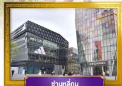
ชานหลี่กู่