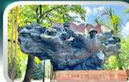
Panfilov Guardsmen Park