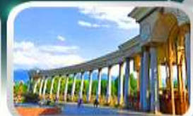
1st President Park