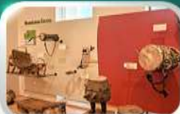
Museum of Folk Instrument