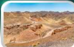
ชารินแกรนด์แคนยอน