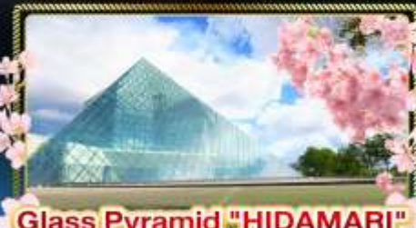
Glass Pyramid "HIDAMARI"