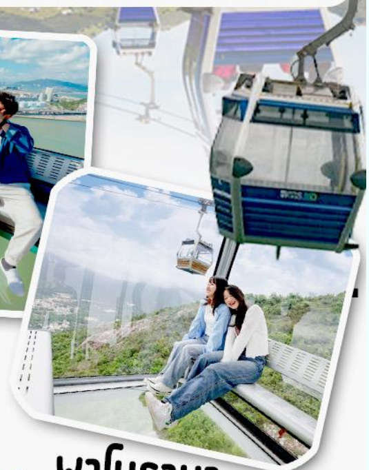
พานิราม่า