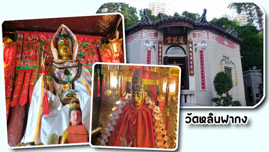
วัดหลินฟาง

นอกจากนี้ทางวัดหลินฟ้าก็ยังมี เทพเจ้าสาวจื่อเอี๊ยะ หรือเทพเจ้าสายนรก เป็นเทพเจ้าที่ขึ้นชื่อเรื่องกตัญญูที่มาในรูปแบบลักษณะการรุ่มง่อม ผ่าดิบ ซึ่งเป็นสัญลักษณ์ของการไว้ทุกข์ที่คนเชื้อสายจีนให้ความสำคัญ เทพเจ้าองค์นี้ก็เปี่ยมไปด้วยพลังหยิน ซึ่งเป็นด้านเกี่ยวกับเงินทองของ สำหรับผู้ที่ชอบเสี่ยงโชค