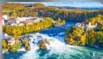
น้ำตกไรน์