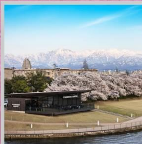
"TOYAMA KANSUI PARK"