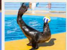
POLAR OCEAN PARK