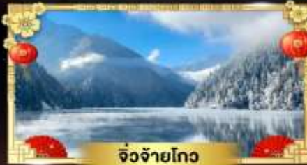
จี๋จ้ายโกว