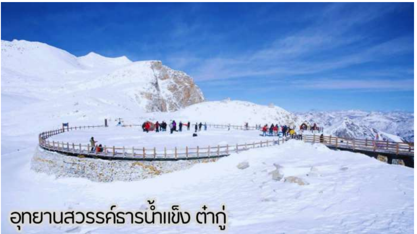
อุทยานสวรรค์ธารน้ำแข็ง ต่ากู๋

นำท่านเดินทางสู่ อุทยานสวรรค์ภูผาหิมะการ์เซีย “ต่ากู๋ปิงชว่น” ถือได้ว่าเป็นอุทยานสมบัติทางธรรมชาติที่ล้ำค่าของมณฑลเสฉวน ที่มีความงามไม่แพ้อุทยานและทะเลสาบใดใดบนโลกมนุษย์ อุทยานสวรรค์ภูผาหิมะการ์เซีย “ต่ากู๋ปิงชว่น” ถูกค้นพบผ่านดาวเทียมเมื่อปี ค.ศ. 1992 โดยนักวิทยาศาสตร์ชาวญี่ปุ่น หลังจากได้ตรวจสอบพื้นที่จึงทราบว่าที่เป็นธารน้ำแข็งที่ตั้งอยู่ต่ำที่สุด ใหญ่ที่สุด และอายุน้อยที่สุดในโลก และยังคงตั้งอยู่ไม่ไกลจากตัวเมืองทำให้สามารถเดินทางไปท่องเที่ยวได้ง่าย ซึ่งคนในพื้นที่มีความเชื่อว่าภายในธารน้ำแข็งแห่งนี้มีเทพเจ้าศักดิ์สิทธิ์พิทักษ์อยู่ จึงทำให้ไม่มีใครสามารถพิชิตยอดเขาแห่งนี้ได้ จุดที่สูงที่สุดมีความสูงจากระดับน้ำทะเลประมาณ 5,286 เมตรเป็นภูเขาน้ำแข็งที่ศักดิ์สิทธิ์ ชาวบ้านเชื่อว่ามีเทพเจ้าพิทักษ์ภูเขานี้ทำให้ภูเขานี้ยังมีคนมีใครพิชิตยอดเขาได้